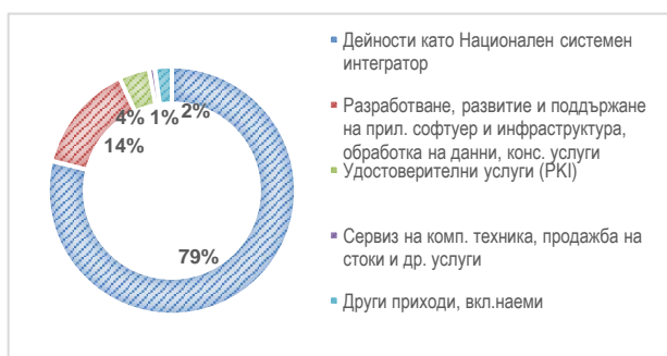
Графика № 1.2. ИО – Структура на приходи по услуги за периода 01.01. – 31.03.2024 г.