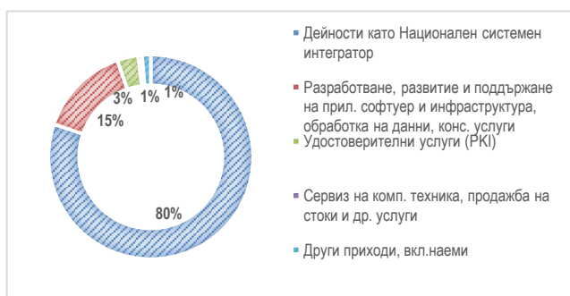
Графика № 1.2. ИО – Структура на приходи по услуги за периода 01.01. – 30.06.2023 г.